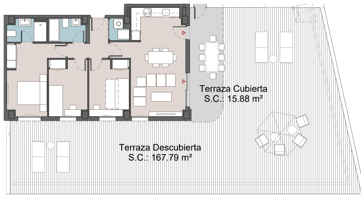
A3 - 1:140